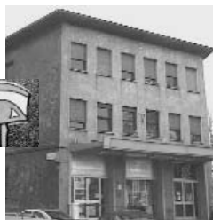
OSPEDALE FATEBENEFRAPELLI E OFTALMICO Corso di Porta Nuova 23 Milano