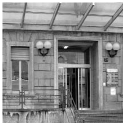
OSPEDALE MACEDONIO MELLONI Via M. Melloni 52 Milano